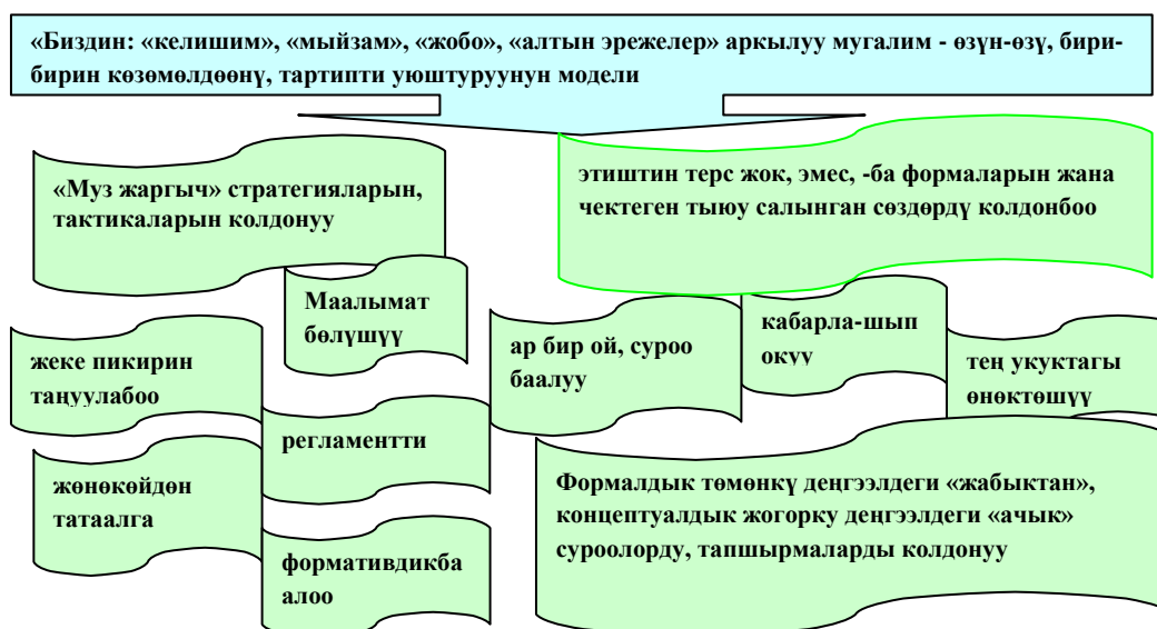
2-сүрөт. Психологиялык–педагогикалык оң жагдайды түзүүнүн модели

лык-педагогикалык ыңгайлуу жагдайды түзүү аркылуу окуучуларды интерактивдүү ишмердикке багыттоо зарыл экендиги тастыкталды.