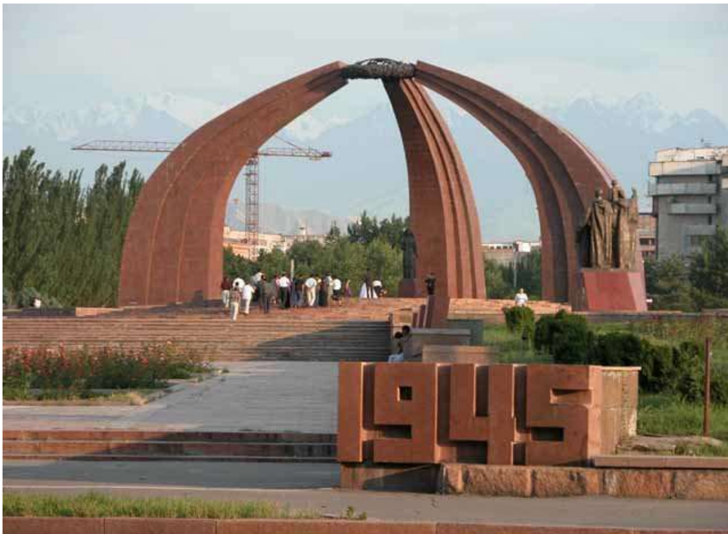
Жеңиш эстелиги, Бишкек шаары