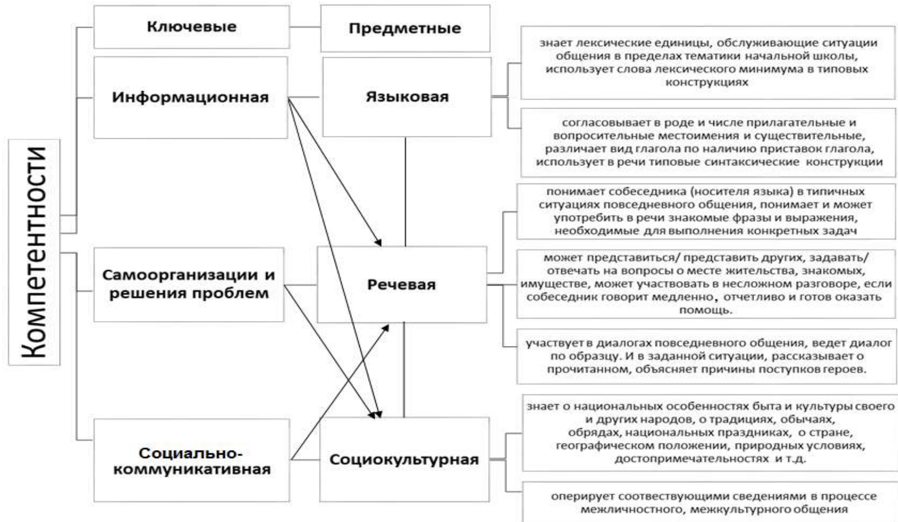
Схема 1. Связь ключевых и предметных компетентностей