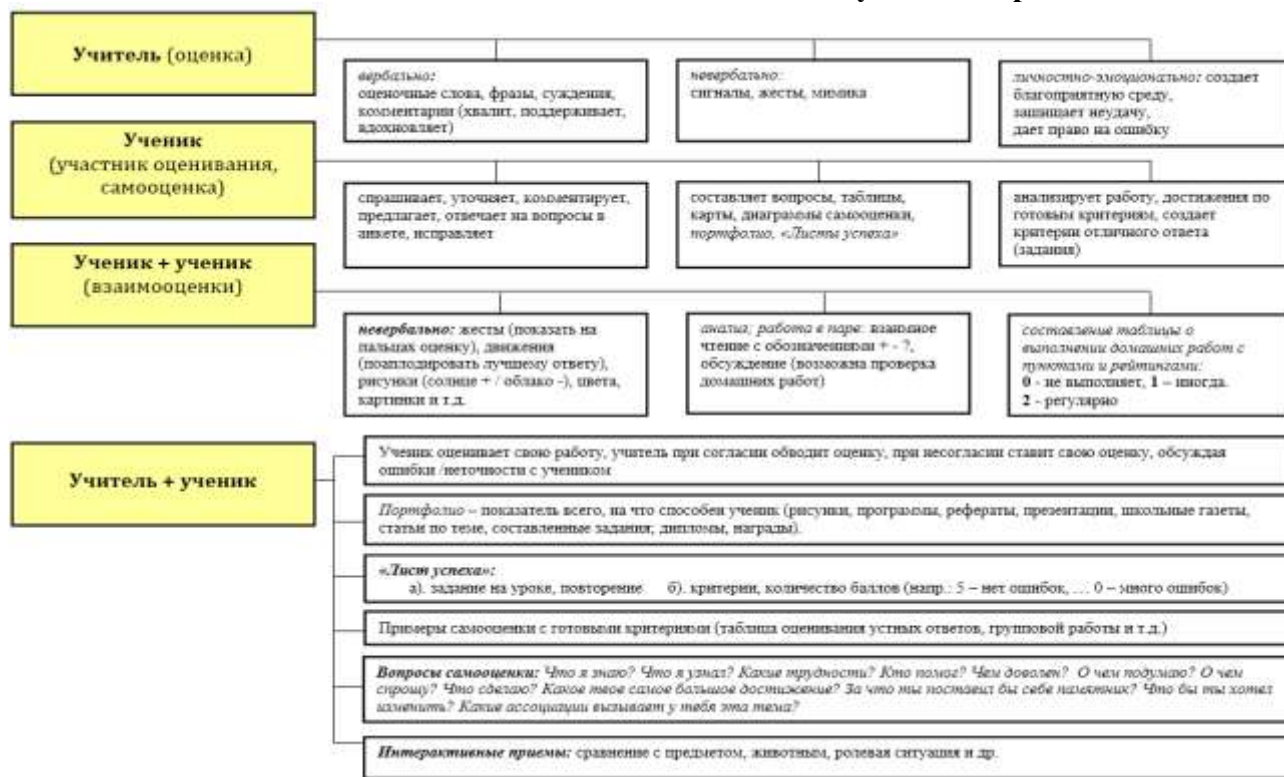
Схема 2. Оценивание как составная часть учебного процесса

По отношению к каждому из ожидаемых результатов рекомендуется уделять преимущественное внимание отдельным группам методов и источников информации для оценивания.