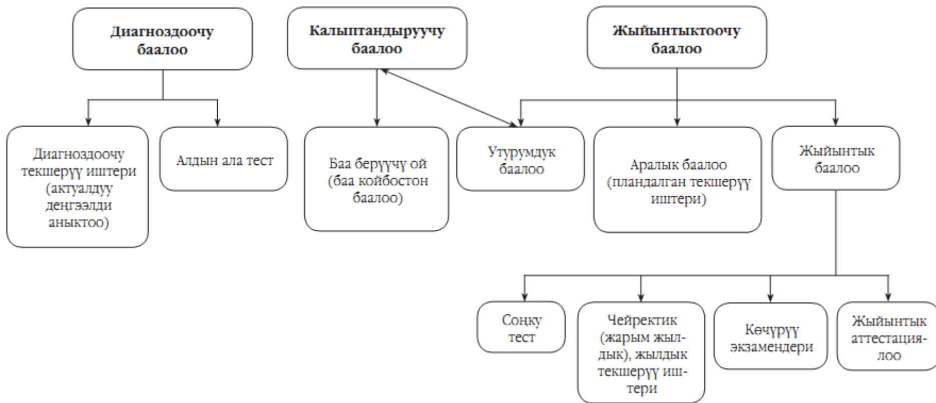
Схема: Баалоонун түрлөрү