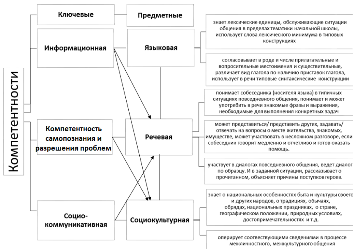
Схема 1. Связь ключевых и предметных компетентностей

Указанные в схеме взаимосвязи являются основой для формулирования образовательных результатов и индикаторов по предмету «Русский язык и чтение» в школах с кыргызским, узбекским и таджикским языками обучения».