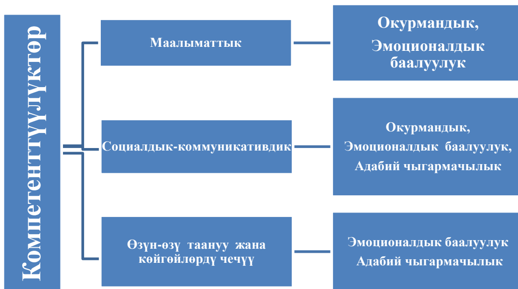
1-схема: Негизги компетенттүүлүктөрдүн предметтик компетенттүүлүктөрдө көрсөтүлүшү.