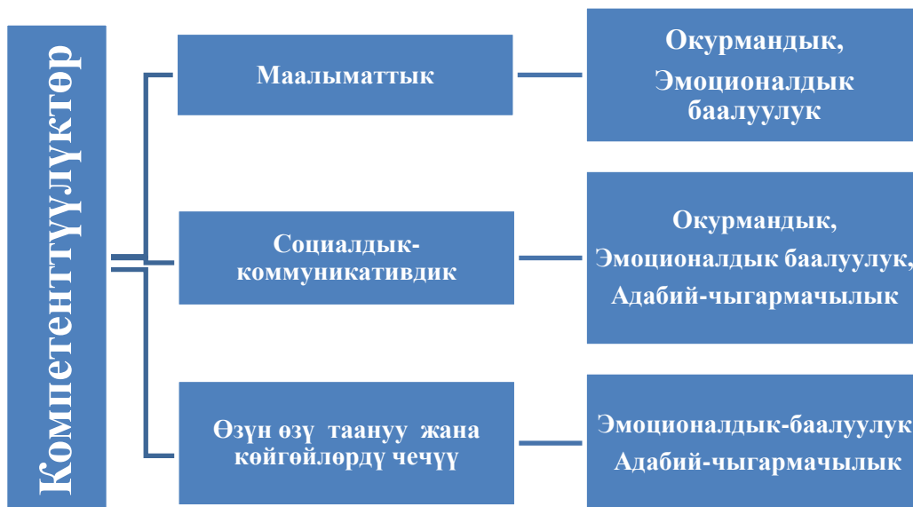
1-схема: Негизги компетенттүүлүктөрдүн предметтик компетенттүүлүктөрдө көрсөтүлүшү.

Негизги жана предметтик компетенттүүлүктөрдүн байланышы предметтик компетенттүүлүктөрдүн билим берүүчүлүк натыйжаларда ишке ашырылышын көрсөткөн мисалдар менен 1-схемада көрсөтүлгөн.